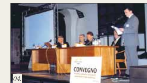
03. Anniversario 10 anni di Service Legno 04. 1° Convegno Service Legno 2003 05. Anniversario 10 anni di Service Legno 06. Presentazione Centro Anziani di Treviso 2007

"Noi di Service Legno crediamo nel materiale primario naturale che è il legno e conosciamo bene i traguardi che tale materiale rende possibili".