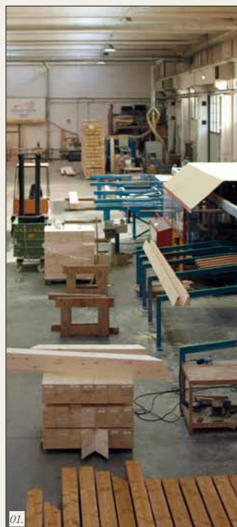
01. Il laboratorio di taglio 02. La sede centrale di Spresiano (TV)

tutto il territorio nazionale grazie alle due sedi: la sede principale tecnico-produttiva è situata a Treviso. Nel Marzo 2008 è stata creata Service Legno Due a Perugia per l'assistenza tecnico-commerciale per i clienti del centro Italia. Ha realizzato più di 200 unità abitative con struttura in legno, singole, eco villaggi, condomini, ampliamenti, sopraelevazioni ed edifici pubblici come asili, scuole, centri anziani mettendo a disposizione la propria serietà a garanzia della qualità del risultato. Questi risultati testimoniano la versatilità e la capacità costruttiva di Service Legno. Service Legno ha lavorato per personaggi illustri, come Jury Chechi e Jacopo Fo, famosi oltre che per le prestigiose carriere, anche per i loro valori umani, testimoni di come la passione ed il sacrificio siano indispensabili per il raggiungimento di grandi risultati. È inoltre intervenuta nelle opere di ricostruzione dopo il sisma in Abruzzo: con la costruzione di Casa Onna, nuovo centro civico della cittadina colpita dal sisma abbattutosi nell'aprile 2009 e con la donazione dell'asilo "La Velocca" a Poggio Picenze (AQ), coinvolgendo 56 aziende leader del settore per offrire un aiuto concreto alle famiglie abruzzesi.